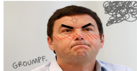
Et pourtant il n'est pas content.

Au premier abord les propositions de Piketty dans Pour un nouveau système de retraite (2008) ressemblent beaucoup à celles du gouvernement : système universel à points.