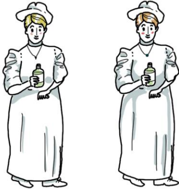
Avant la Sécu : travail bénévole d'une sœur hospitalière